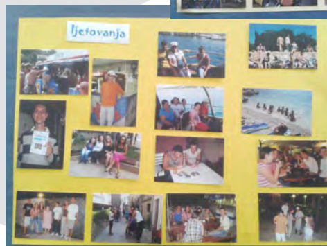
ljetovanja na kraju nastavne godine