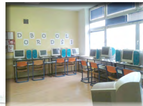
pomoćni grafičar za unos teksta